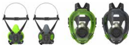
Halbmasken BLS 4000 S - BLS 4000R