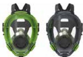
Vollmasken BLS 5700 - BLS 5600