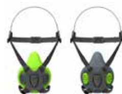
Halbmasken BLS 4000 S - BLS 4000 R