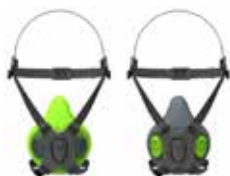
Halbmasken BLS 4000 S - BLS 4000R